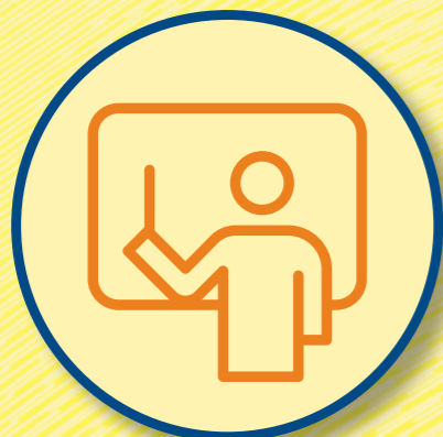
Voluntat i, per tant, vulgui deixar-se acompanyar i rebre pautes o formació, per part de les professionals del projecte JOVES FUTUR+.