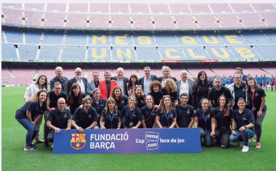
L'equip de la Fundació amb diversos membres del Patronat i col·laboradors i col·laboradores externs.