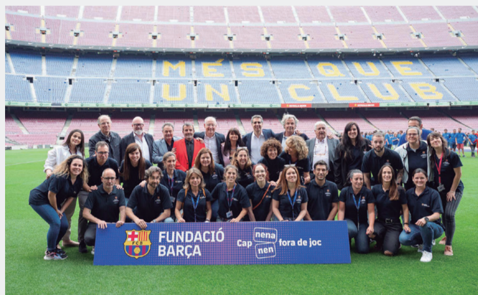
El equipo de la Fundació con varios miembros del Patronato y colaboradores y colaboradoras externos.